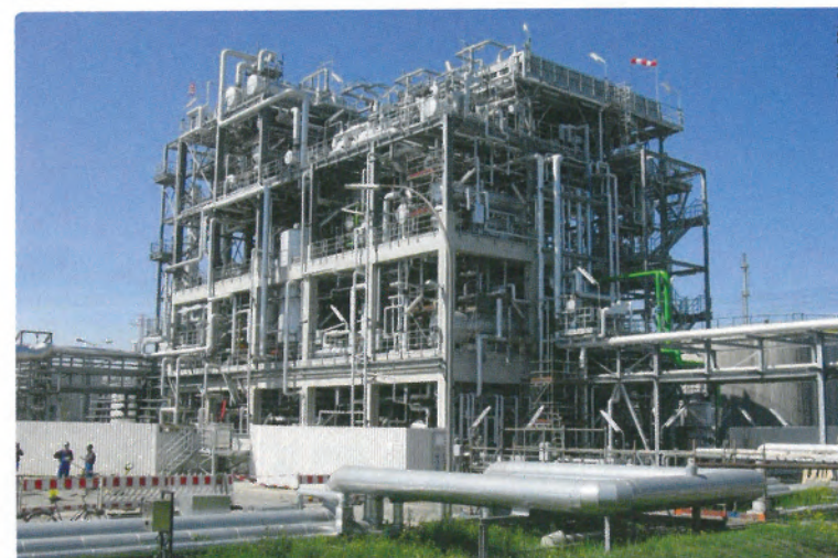
Propanentasphaltierungsanlage (PDA), H&R Ölwerke Schindler, Hamburg, Deutschland

* Der Autor leitet den Geschäftsbereich Verfahrenstechnik bei EDL Anlagenbau, Leipzig. Kontakt: Tel. +49-341-4664400